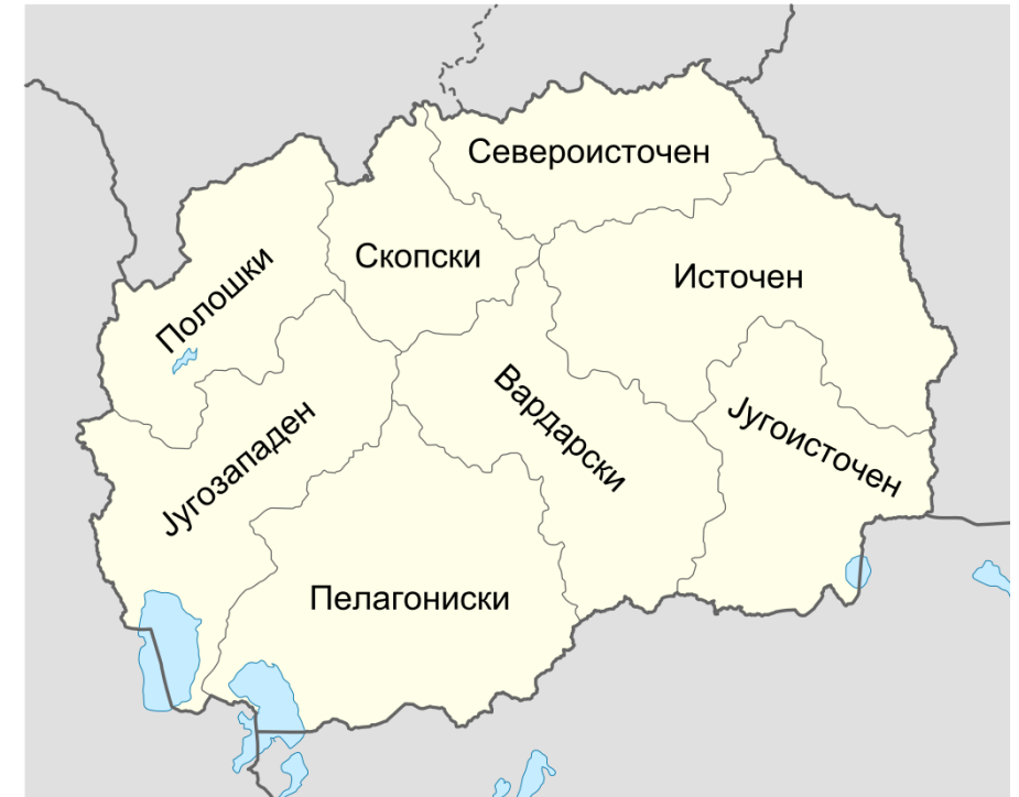
8 плански региони во РМ.